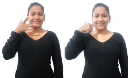
Figura 3 – Sinal híbrido (LSV e Libras) para a palavra DELÍCIA

ponto de articulação. Se diferenciam, de forma mais evidente, pela configuração de mão e o pelo movimento que, na Libras, é retilíneo da direita para a esquerda e, na LSV, há além do movimento idêntico ao da Libras, um movimento da esquerda para a direita. Maryha inicia o sinal em Libras (com movimento da esquerda para a direita) e termina em LSV, com movimento em sentido contrário e com uma mudança na configuração de mão, como na Figura 3.