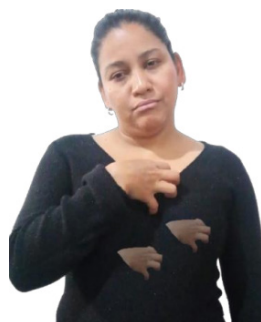
Figura 1 – Sinal 'SAUDADE' em LSV