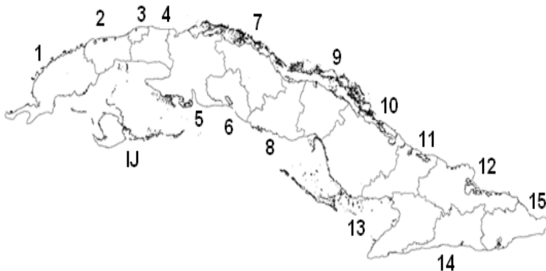
Figura 1. División político-administrativa actual. Provincias: 1, Pinar del Río; 2, Artemisa; 3, La Habana; 4, Mayabeque; 5, Matanzas; 6, Cienfuegos; 7, Villa Clara; 8, Sancti Spíritus; 9, Ciego de Ávila; 10, Camagüey; 11, Las Tunas; 12, Holguín; 13, Granma; 14, Santiago de Cuba; 15, Guantánamo; IJ, municipio especial Isla de la Juventud.

Los nombres de localidad, provincia y municipio se refieren según la división político-administrativa actual (GACETA OFICIAL DE LA REPÚBLICA DE CUBA, 2010) (Fig. 1).