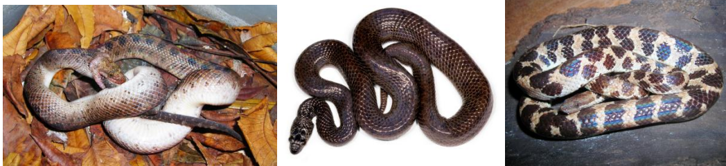
Figura 3. De izquierda a derecha: Tropidophis celiae , T. fuscus y T. spiritus .

De las 15 provincias y la Isla de la Juventud existen ejemplares en la colección del IES (Fig. 4), las de mayores números son La Habana, Pinar del Río y Artemisa, mientras que Cienfuegos y Granma son las de menos.