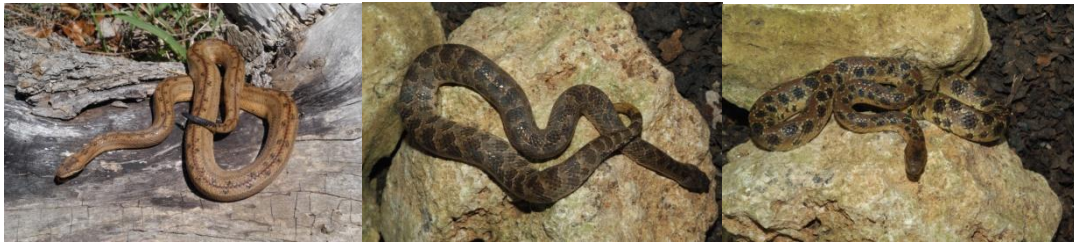
Figura 2. De izquierda a derecha: Tropidophis melanurus , T. pardalis y T. maculatus . Fuente Libro Anfibios y Reptiles de Cuba 2003 (Rodríguez Schettino, ed.).