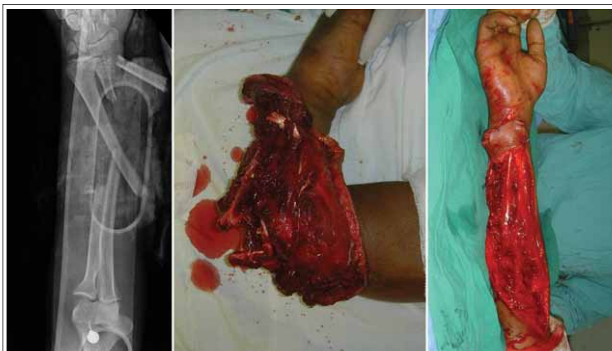
▲ Figura 1. Paciente de 19 años. Accidente en el campo. Pérdida segmentaria del nervio cubital (15 cm).

Como en su mayoría eran traumas de alta energía con defectos graves de tejidos blandos, los pacientes presentaron una gran diversidad de lesiones asociadas que necesitaron de diferentes y variadas resoluciones (Tabla). El colgajo paraescapular se combinó con colgajo escapular en tres pacientes y con un colgajo de dorsal ancho (dos libres y uno pediculado) en tres casos (Figuras 1-3). Cuatro pacientes tenían lesiones tendinosas que necesitaron reconstrucción: tres fueron resueltas por transferencias tendinosas en un tiempo y una por reconstrucción tendinosa en dos tiempos, en primera instancia, se colocaron espaciadores de silicona (sonda urológica siliconada pediátrica), para luego, en un segundo tiempo, a los 21 días de la cirugía inicial, realizar el injerto libre de tendón; dicho colgajo, localizado en el dorso del antebrazo y la muñeca, debió ser adelgazado a los seis meses. En once casos, se recurrió a injerto de piel para cubrir áreas expuestas, pero que no necesitaban de cobertura con colgajo libre y estaban contiguas al área lesionada que se cubrió con el colgajo paraescapular; en uno de estos casos, se asoció un sustituto dérmico (Integra®). 10 Diez pacientes tenían