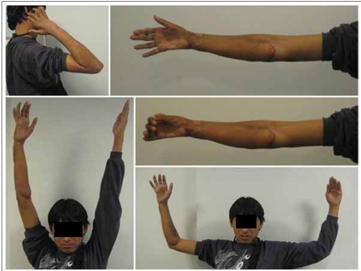
▲ Figura 3. Resultados estético y funcional buenos a largo plazo.