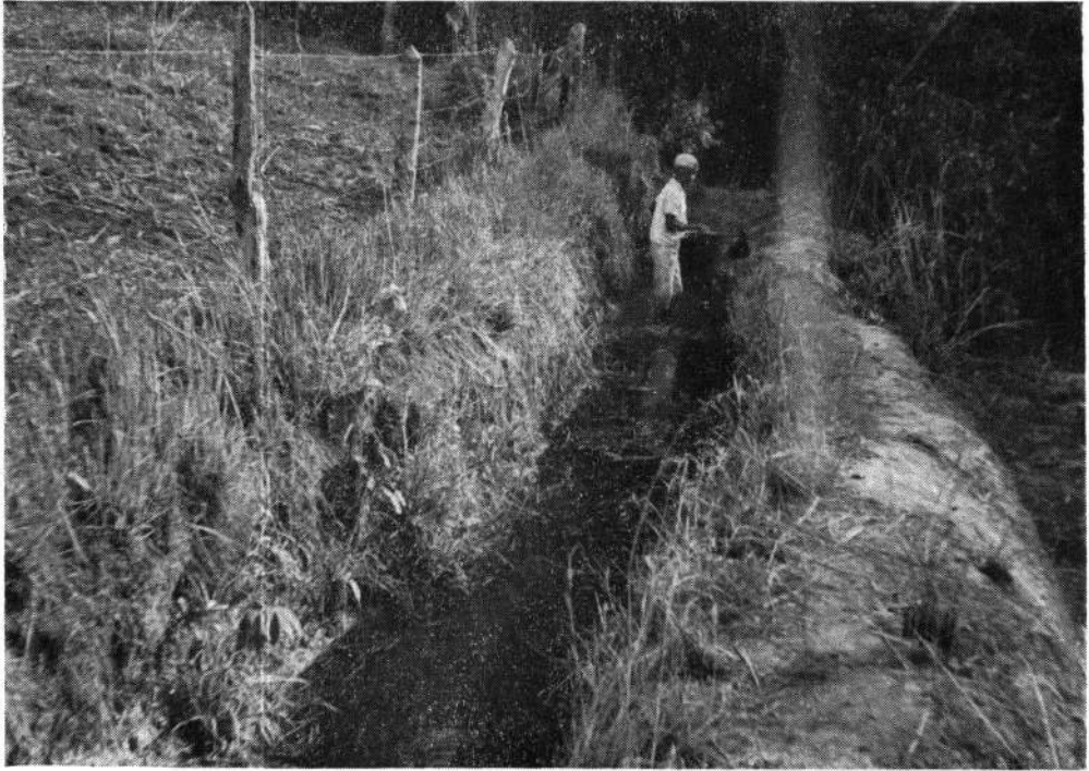
Fig. 2 — Baldim, MG. Vala nº 3, negativa para bionfalaria, mas colonizada por Pomacea haustum a partir de exemplares introduzidos no Córrego Capão Fundo (ver "croquis").