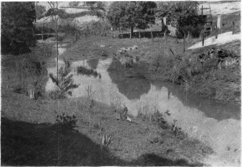
Fig. 3 — Baldim, MG. Córrego Biquinha. Curso d'água no qual foram introduzidos exemplares de Pomacea haustum para controle da população autóctone de Biomphalaria glabrata .