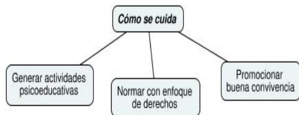
Figura 2 Segunda categoría central y subcategorías: Cómo se cuida

Aun cuando parece difícil que prácticas concretas sean explicitadas en documentos de políticas públicas, se ha buscado intencionalmente acciones de cuidado dirigidas primordialmente a una buena convivencia, mencionadas como formas de cuidar (Figura 2).