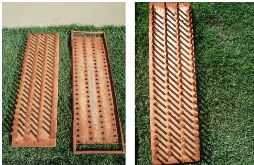
Figura 7 Vista do tabuleiro utilizado para semeadura de sementes de soja em campo.

A semeadura se fez com a utilização de um tabuleiro fornecido pela COODETEC (Figura 7), com comprimento de 1,05 m e largura de 28 cm, e pinos para perfuração de aproximadamente 4 cm de profundidade. O tabuleiro apresenta espaço entre linhas de 8,5 cm e entre plantas de 3,5 cm, de modo a semear 100 sementes por repetição.