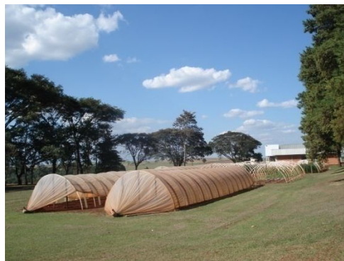
Figura 2 Estufas utilizadas na realização de ensaios experimentais de germinação de sementes e análise de plântulas.

na tentativa de manter sempre uma boa temperatura para as plântulas de soja. Realizava-se irrigação todos os dias durante aproximadamente 20 minutos até que o solo estivesse devidamente úmido (Figura 3), ou seja, o ambiente era controlado de forma a simular uma condição de campo excelente para que a semente germinasse adequadamente e a plântula se desenvolvesse de acordo com o seu vigor.