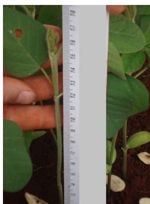
Figura 8 Mensuração de plântula.

Obtidos os valores individuais, calculou-se a altura média das plantas por repetição, fazendo-se a somatória das medidas obtidas, a qual foi dividida pelo número de plântulas mensuradas. A altura média da plântula da cultivar foi obtida pela média aritmética das quatro repetições.