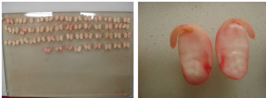
Figura 6 A esquerda, sementes seccionadas longitudinalmente com auxílio do bisturi, prontas para observação e análise. À direita, semente com danificação por picada de percevejo.

As sementes foram avaliadas uma a uma, seccionadas longitudinalmente com auxílio de bisturi, observando a ocorrência de danos nas partes internas e externas dos cotilédones, com atenção especial ao eixo hipocótilo-radícula (Figura 6).