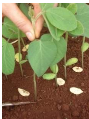
Figura 9 Plântulas sendo cortadas rente ao solo para o teste de massa seca.

Foram utilizadas as plântulas avaliadas no teste de emergência, as quais foram cortadas rentes ao solo (Figura 9) e levadas ao laboratório, e então colocadas em estufa a 60°C até atingirem massa constante. Esse material foi pesado em balança de precisão 0,001g. A massa obtida foi dividida pelo número total de plântulas da amostra, constituindo-se assim a massa seca média de plântula por cultivar (NAKAGAWA, 1999).