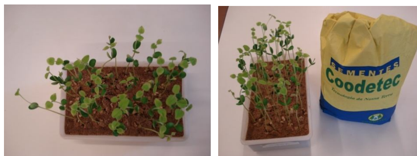
Figura 4 Vista de uma das bandejas no teste de emergência em areia.

Foi utilizada areia com textura média como substrato. Quatro amostras de 50 sementes por tratamento foram semeadas em caixas plásticas com volume de 3,0 L e mantidas em condições ambientais de laboratório, temperatura média em torno de 25°C, com regas diárias para manter a umidade. As plântulas normais foram avaliadas no 8º dia (BRASIL, 2009), quando retiradas da areia, foram lavadas em água corrente para observação do sistema radicular e realizada a contagem final.