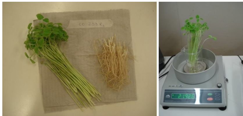
Figura 5 Imagem da esquerda plântulas após lavagem, corte e medida da parte aérea e raiz, prontas para pesagem. Imagem da direita, pesagem de massa verde da parte aérea.

O material verde foi pesado, por repetição, em balança de precisão 0,001 g. A massa obtida foi dividida pelo número de plântulas que compunham a repetição, obtendo-se a massa da matéria seca por planta. A média aritmética das quatro repetições avaliadas constituiu a massa média da matéria seca da planta da cultivar.