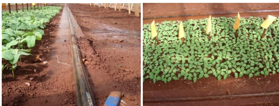
Figura 3 Sistema de irrigação utilizado nos experimentos.

Os testes realizados em campo foram: porcentagem de emergência das plântulas no campo, crescimento e massa seca da plântula (NAKAGAWA, 1982); índice de velocidade de emergência em campo (IVE) (MAGUIRE, 1962); velocidade de emergência em campo (VE) (EDMOND e DRAPALA, 1958); coeficiente de velocidade de emergência em campo (CVE) (FURBECK et al. , 1993).