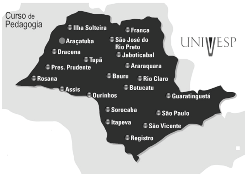
Figura 1 - Mapa do estado de São Paulo com a localização dos polos que oferecem o curso de pedagogia do programa Unesp/Univesp.