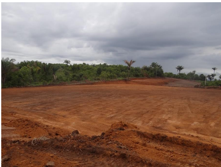
Fonte: registrado por Jondison Rodrigues no dia 08 de dezembro de 2019

Figura 4: Área onde será construída nova escola, centro comunitário e campo de futebol, comunidade de Santarenzinho, Rurópolis, Oeste do Pará