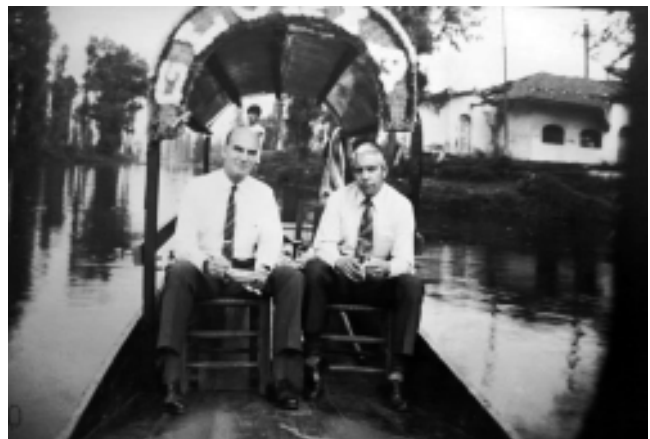
Figura 2. Dr. Roberto Caldeyro Barcia de visita en Xochimilco, Distrito Federal.

La historia del monitoreo cardiotocográfico, al igual que otras invenciones en la medicina, está acompañada de coincidencias y controversias. El mejor ejemplo es la originalidad de los trabajos del Dr. Caldeyro y del Dr. Hon, donde la literatura hispana o sajona, respectivamente, los reconoce como los pioneros e inventores de la cardiotocografía moderna.