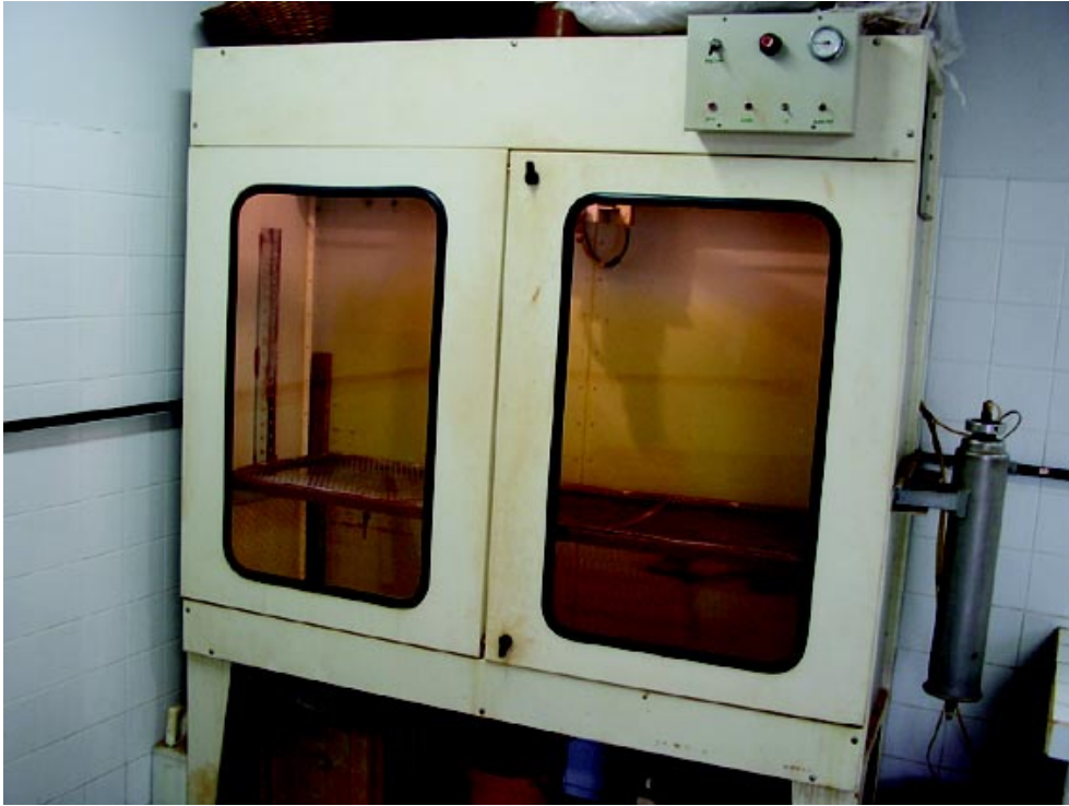
Figura 1. Câmara de aspersão onde foram feitas as aplicações de glyphosate.

Os resultados foram submetidos à análise da variância do programa estatístico SAS (Statistical Analysis System), com o objetivo de verificar se as doses do herbicida glyphosate acusaram efeito significativo na resposta das plantas daninhas. Para isso, foram utilizados somente os dados da variável biomassa verde, pois a biomassa seca apresentou grande variabilidade, não apresentando bom ajuste da curva dose-resposta. A determinação da curva dose-resposta obtida pelo modelo matemático log-logístico, proposto por SEEFELDT (1995), é a seguinte: