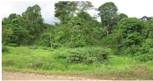
Gambar 2. Areal TPTII/SILIN yang memiliki jalur bersih selebar 3 m dan jalur kotor selebar 17 m

TPTII/SILIN sebagai tempat beristirahat dan bermain. Sebaliknya, pada areal hutan produksi yang dikelola dengan sistem TPTI, tidak dijumpai kondisi yang serupa. Kurangnya kerimbunan semak belukar pada areal yang dikelola dengan sistem TPTI dapat disebabkan karena tegakan tinggal yang terdapat di areal tersebut telah berusia belasan tahun, sehingga telah memiliki kanopi yang cukup rapat dan menyebabkan kurangnya tumbuhan bawah di areal tersebut.