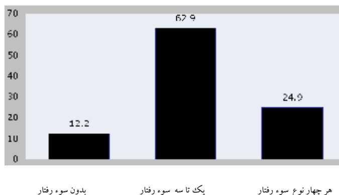
نمودار شماره 1: مودار توزیع فراوانی نمونه‌های پژوهش بر حسب وسعت سوءرفتار

های انجام شده، بین سوءرفتار با سن سالمند رابطه معنی‌دار دیده شد. بدین معنی که با افزایش سن، میزان سوءرفتار نیز بیشتر شده بود. از طرفی، بین سوءرفتار و جنس، سطح تحصیلات، وضعیت تأهل، نحوه زندگی و ناحیه جغرافیایی رابطه معنی‌داری یافت نشد.