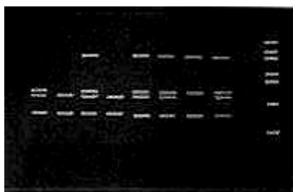
Gráfica 2. Gel page 8%. Resultado de la amplificación con el sistema 4 plex. Columna 1. Marcador de peso molecular Puc18 (fragmentos de 501, 489, 404, 353, 242, 190 y 110 pb). Columna 2. Blanco de amplificación (no se observan bandas). Columna 3. Control normal de amplificación con sistema 4 plex, se observan cuatro bandas correspondientes a los exones 3: 410 pb, exón 6: 202 pb, exón 47: 181 pb, exón 60: 139 pb. Columna 4. Paciente DM1: delección exón 47. Columna 5. Paciente DM8: completo. Columna 6. Paciente DM10: completo. Columna 7. Paciente DM12: delección exones 3. 6. Columna 8. Paciente DM14: completo. Columna 9. Paciente DM17: delección exones 3 y 6. Columna 10. Paciente DM29 con delección exón 3.

las condiciones estandarizadas (Cuadro 2).