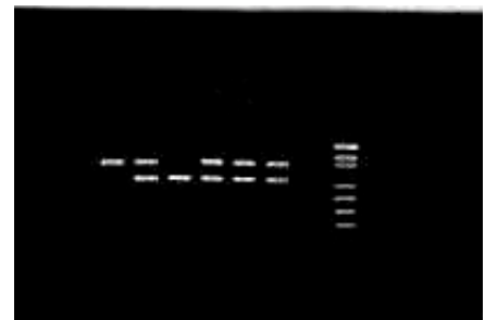
Gráfica 4. Amplificación 2 plex. 1. Puc 18 cortado con MSPI. 2: Blanco. 3: Control normal: exon 8 (360 pb) y exón 44 (268 pb). 4: DMD 2: completo. 5: DMD 8: Completo. 6: DMD 9: deleción exón 8. 7: DMD 10: Completo. 8: DMD 7: Deleción exón 44.

terogéneo nuclear, conduciendo el buen ensamblaje del spliceosoma, para que se dé un correcto ARN mensajero, que codifica para la distrofina 42 . Los elementos que actúan en cis , interactúan con elementos trans (como ribonucleoproteínas pequeñas nucleolares y otras proteínas auxiliares) y también dirigen el ensamblaje correcto del spliceosoma. El exón 19 además, tiene una región rica en purinas, que corresponde a una secuencia de reconocimiento de exones (ERS). Las ERS son necesarias para el splicing del exón inmediatamente anterior 43 y promueven la inclusión (del exón 18) dentro del ARNm maduro por medio de una selección correcta de los