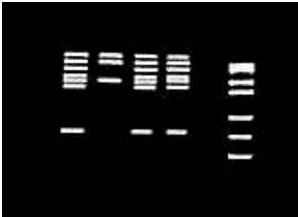
Gráfica 5. Amplificación 7 plex. 1. Puc 18 cortado con MSPI. 2. Blanco de amplificación. 3. Control normal 7 plex: Exón 45 (547 pb), Exón 48 (506 pb), Exón 19 (459 pb), Exón 17 (416 pb), Exón 51 (388 pb), Exón 12 (331 pb), Exón 4 (196 pb). 4. DMD 15: completo; 5. DMD 17: Delección exones 17, 19, 12 y 4. Carril 6: DMD 52: Completo.

El otro paciente (DMD) 44 tuvo una delección in frame que afectó los exones 48 al 51; sin embargo, el fenotipo de este paciente es severo (DMD), esto se puede atribuir a la generación de un codón de parada prematuro como consecuencia de la delección, lo cual se puede corroborar mediante el análisis de la expresión del ARNm 12,44 .