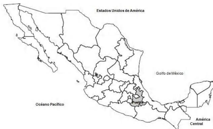
Figura 1. Ubicación geográfica del estado de Puebla, México (CONABIO, 2011)

El sitio de estudio se ubica en dos sistemas serranos del estado de Puebla, México (Fig. 1); que es una entidad de orografía compleja, formada por varios conos volcánicos, sierras, depresiones, llanuras y altiplanos (CONABIO, 2011). En esas sierras, se distribuye in situ el venado temazate rojo (VILLARREAL et al. , 2008b). En Puebla, el primer sistema serrano pertenece a la cordillera de la Sierra Madre Oriental, y son las denominadas Sierra Norte y Sierra Nororiental. Por otra parte, otra serranía es la Sierra Negra, que pertenece a la Sierra Madre de Oaxaca (TAMAYO, 1990). Estos territorios montañosos, tienen las siguientes características eco-geográficas: en todas confluyen las regiones biogeográficas Neártica y Neotropical (TAMAYO, 1990). Por tal motivo, existe una gran variedad topográfica, climática y biótica (CONABIO, 2011). Las sierras Norte y Nororiental como lo indica su nombre se ubican en aquellas zonas geográficas del Estado; mientras que la Sierra Negra, abarca la punta sureste del mismo.