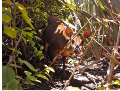
Figura 2. Venado temazate rojo ( Mazama temama ) hembra, municipio de Eloxochitlán, Sierra Negra de Puebla, México (Fotografía: Oscar Villarreal EB, 2010)