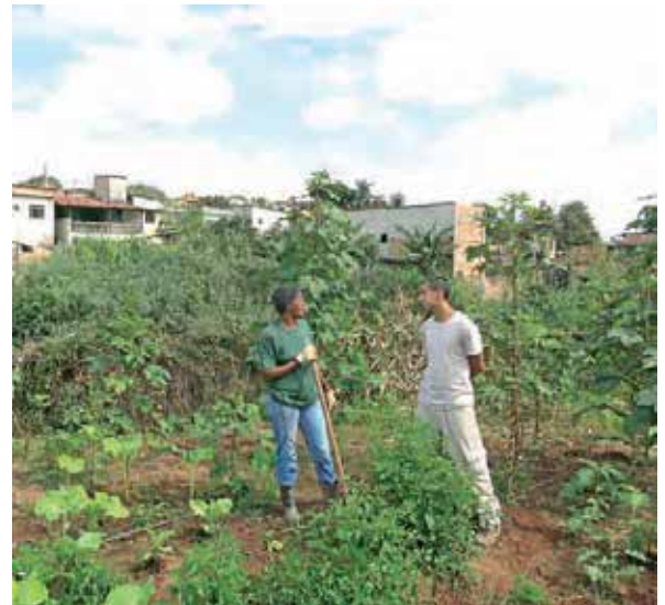
Figura 1: Horta comunitária Vila Pinho, em Belo Horizonte.