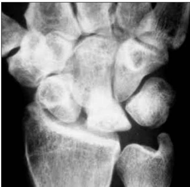
▲ Figura 2. Paciente de 45 años con enfermedad de Kienböck estadio IIIA. Radiografía anteroposterior preoperatoria.

De acuerdo con los hallazgos de Sherman y cols., creemos que el efecto beneficioso de la técnica de descompresión metafisaria del radio distal no es causado por la descarga de la hiperpresión de la superficie de la fosa lunar del radio (efecto mecánico), sino por alguna reacción biológica vascular no conocida que es generada por el procedimiento a nivel regional. 17 Nuestra hipótesis es que, al igual que otros procedimientos óseos cercanos al semilunar, la descompresión del radio genera un estímulo vascular regional en los huesos del carpo. La osteotomía del radio generaría –al igual que lo ya comprobado en las