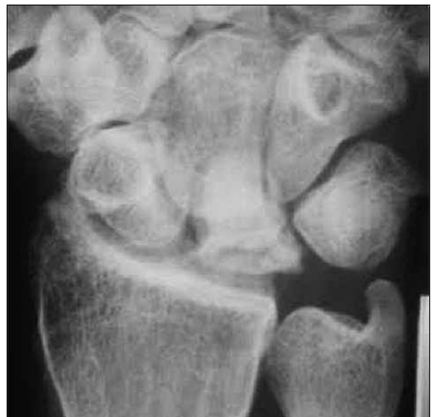
▲ Figura 3. Radiografía anteroposterior a los 12 años de la descompresión ósea metafisaria.