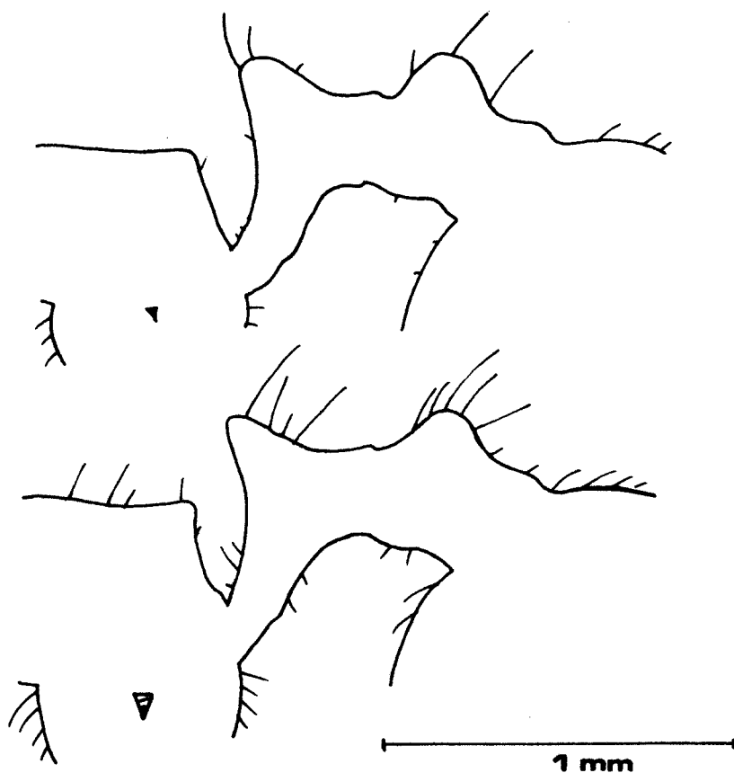
Figura 3.- Vista lateral comparativa del epinoto, peciolo y postpeciolo de M. celiae (arriba) y M. hispanicus (abajo).

Cabeza muy pequeña en relación con el resto del cuerpo, triangular, aproximadamente igual de ancha (tras los ojos) que larga (longitud/anchura = 1,03). Mandíbulas de cinco dientes, decreciendo de tamaño desde el apical al basal, que no siempre está desarrollado, sin presentarse nunca seis como en M. hispanicus ; a veces un diente se presenta subdividido. Las mandíbulas presentan estriación longitudinal y pequeñas sedas tumbadas recubriendolas. Palpos maxilares de cinco artejos y labiales de tres. Clípeo algo abombado, con varias sedas largas dirigidas hacia abajo y sobrepasando las mandíbulas. Ojos grandes y salientes de color negro. Ocelos medianos ocupando el vértex, con la distancia entre el anterior y uno de los posteriores aproximadamente tres veces su diámetro. Angulos occipitales redondeados, al igual que el borde posterior. Escapo corto, sin llegar al ocelo posterior. El primer artejo del funículo es más an-