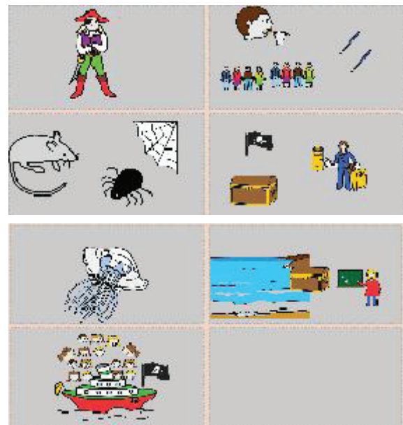
Figura 2. História criada pelos alunos com uso do SCALA no módulo narrativas visuais

A seguir apresenta-se a produção dos alunos.