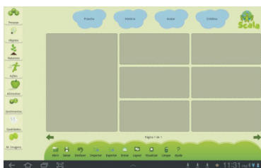
Figura 1a. Módulo prancha

Para que se possa visualizar o Scala a seguir, apresentam-se os layouts do Módulo Prancha (Figura 1a) e Módulo História (Figura 1b e 1c) da versão tablet.