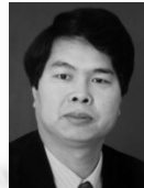
焦李成(1959—),男,博士,教授,博士生导师,CCF 高级会员,主要研究领域为神经网络,机器学习,自然计算,图像感知和认知.