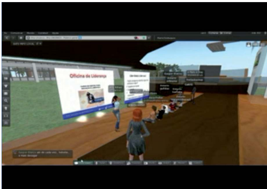
FIGURA 3 – Sala de Reunião Virtual

Fonte: Dados de Pesquisa - Extraído do Vídeo do Encontro 3.