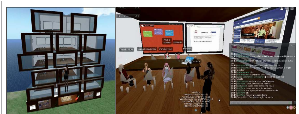
FIGURA 4 – Prédio e Sala de Reunião (1º Encontro do Grupo 1 no SL)