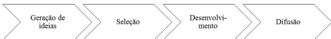
Figura 1 Cadeia de valor da inovação