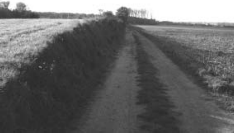
Figuur 3. Deels vergraven restant van de Graafjansdijk bij Bentille.