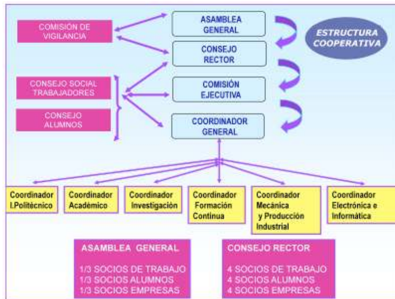
Figura 1: Estructura cooperativa de la Escuela Politécnica Superior