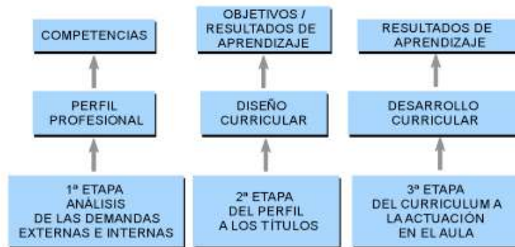
Figura 7. Etapas del diseño del plan formativo en la Goi Eskola Politeknikoa/Escuela Politécnica Superior de Mondragon Unibertsitatea