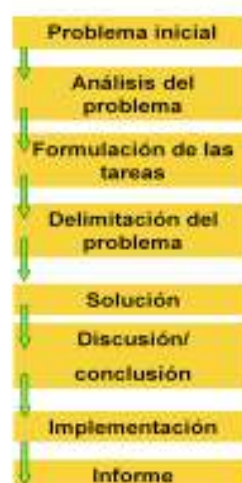
Figura 9. Fases del Método de aprendizaje basado en proyectos.