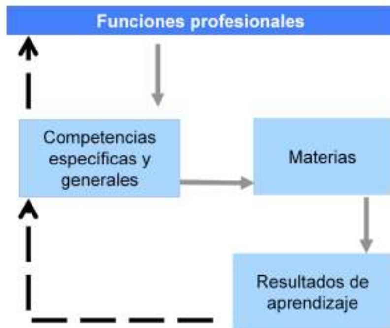
Figura 8. Flujo del diseño y evidencias del plan formativo en la Escuela Politécnica Superior de Mondragon Unibertsitatea