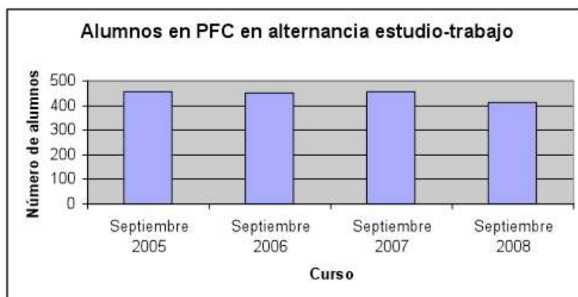
Figura 5. Alumnos que realizan el Proyecto Final de Carrera en alternancia estudio-trabajo en la Goi Eskola Politeknikoa/Escuela Politécnica Superior de Mondragon Unibertsitatea