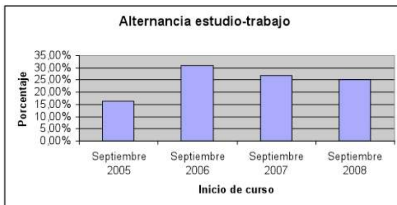
Figura 4. Porcentaje de alumnos en el programa de alternancia en la Goi Eskola Politeknikoa/Escuela Politécnica Superior de Mondragon Unibertsitatea

Supone un reto para el centro fomentar esta alternancia y conseguir que gran parte de los estudiantes participen en ella. Hoy en día el número de estudiantes que participa en ella es el que se muestra a continuación.