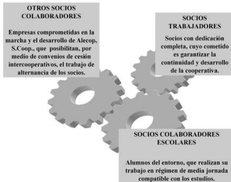
Figura 3. Estructura cooperativa de Alecop