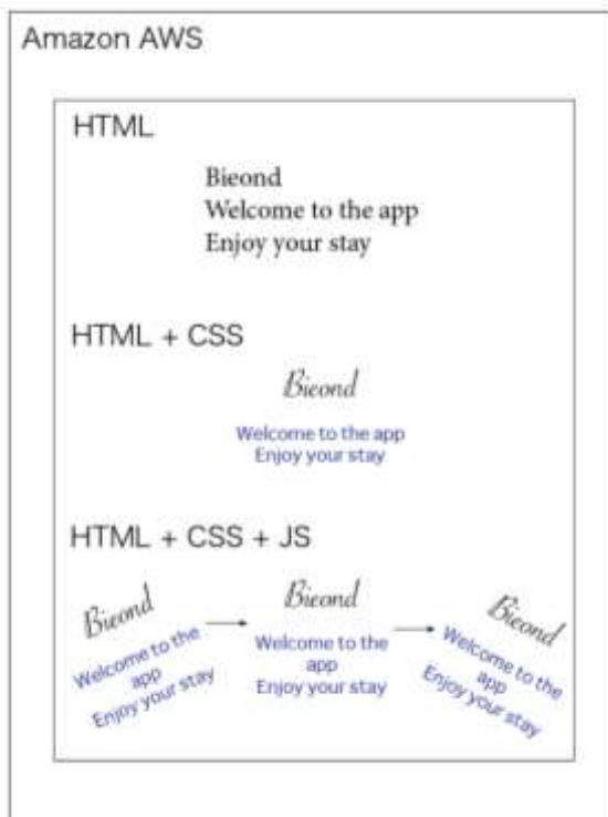
Figura 1. Recursos tecnológicos utilizados

A través del análisis de las web-Apps, el mapping de los indicadores para la personalización del contenido, la selección de las herramientas tecnológicas más adecuadas y regidos, por principios pedagógicos y de diseño, se ha creado el prototipo de la web-App Bieond®.