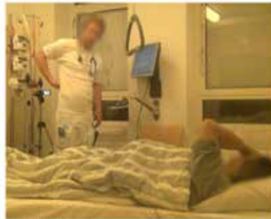
Billede J: 08:23:20 I.18, L: op mod læ[nd]en herop

På grund af L's multimodale handlinger kan P forholde sig til en konkret narrativ; den semantiske betydning af opsummeringen, alt imens hun også kan relatere L's gestik til symptomers lokalisering på sin egen krop. Dette er en funktionel og effektiv strategi, der skaber klarhed og forbinder et smerteområde til et visuelt genkendeligt felt fremfor til en medicinsk fagkategori. Det er ofte tilfældet, at den gennemsnitlige patient ikke er klar over den specifikke grænse mellem fx mave- og brystregion eller mellem lænd og hofte. L's gestik fungerer derfor som en form for kropslig indeksikalitet (billede H og G), der frembringer en specifik betydning, og som gør, at P's hukommelse faciliteres af en multimodal narrativ. L og P er i stand til at samhandle og tilpasse sig de skift, der sker i DCS, fx da L tilpasser sin perception af P's lokalisering af smerter, mens han bevæger sin egen hånd.