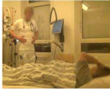
Billede H: 08:20:20 I.18, L: du har ikke sådan decideret mavesmerter