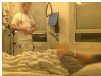
Billede D: 08:03:50 L11, L: har haft tiltagende maveomfang