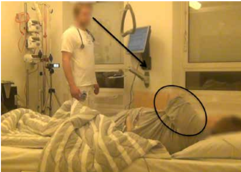
FIGUR 4: OVERBLIK OVER SITUATIONEN

Det sidste eksempel involverer en dialog mellem en mandlig læge og en kvindelig, ældre patient, der er ankommet på akutafdelingen grundet stærke mavesmerter tidligere på dagen. Hendes sygehistorie er kompliceret, og hun er diagnosticeret med en række kroniske sygdomme. Opgaven er derfor at få defineret de specifikke symptomer, hun har, så lægen kan se en sammenhæng mellem lokale smerter og kroniske sygdomme eller nye akut opståede sygdomstilfælde. Nedenfor visualiseres situationen af lægen og patienten.