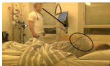
Billede A: 06:58:00 L.L. P. så går det op her

Efter L har bedt P om at lokalisere og beskrive sine smerter, bruger P sin gestik til at vise området og bevægelsen for smerten i sin højre side (se billede A nedenfor).