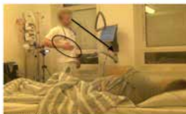
Billede B: 07:03:00 L.L. L. der er du lidt øm [L

Markeringer med fed i transskriptionen under billederne symboliserer den verbale artikulation, der sker, i det øjeblik billedet er taget.