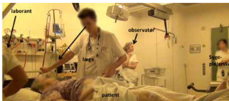
FIGUR 1: OVERBLIK OVER SITUATIONEN

I nærværende eksempel er en ældre dame netop ankommet med 112. Hun bløder rektalt, og hendes situation er akut og uafklaret: Blødningen fortsætter, hvilket er et alvorligt symptom, og ingen ved, hvorfor hun bløder. Til stede er en laborant, en sygeplejerske, en læge, en observatør og patienten. Lægen indleder en dialog med patienten for at få informationer, der kan lede til en tentativ diagnose. Hurtigt bliver han forstyrret af forskellige typer af afbrydelser. Nedenfor præsenteres et øjebliksbillede af situationen.