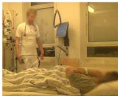
Billede F: 08:06:50 L11, L: og dine ben er også [hævet op