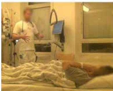
Billede E: 08:04:00 L11, L: har haft tiltagende maveomfang