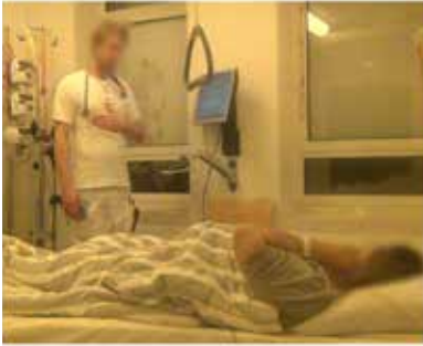
Billede G: 08:08:50 I.13, L: lidt værre med din åndenød