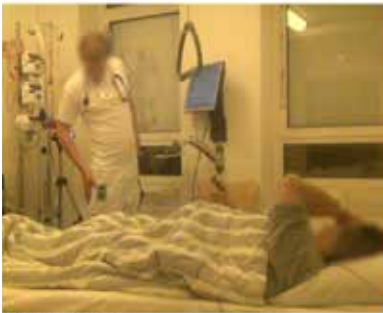
Billede I: 08:21:70 I.18, L: noget der sådan kravler lidt i benene