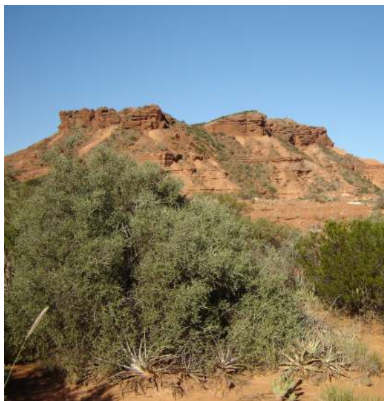
Fig. 1. Comunidad vegetal estudiada en el Parque Nacional Sierra de las Quijadas.

Las tres especies estudiadas son integrantes de la comunidad vegetal ubicada a 822 msnm y 32°29'56.3" Lat. S, 67° 0'34.3" Long. O. Las especies vegetales dominantes en esta comunidad son Aspidosperma quebracho-blanco , Bromelia urbaniana , Bulnesia retama , Larrea cuneifolia , L. divaricata , Prosopis flexuosa , Tillandsia sp, Zuccagnia punctata y algunas poáceas (Del Vitto et al. , 1994). En el sitio de muestreo en particular, formaron parte de la comunidad vegetal: Acacia furcatispina , Adesmia trijuga , Allenrolfea vaginata , Atriplex argentina , A. lampa , Baccharis latifolia , Cyclolepis genistoides , Deuterocohnia longipetala , Digitaria californica , Dyckia floribunda , Echinopsis leucantha , Gomphrena pulchella , Neobouteloua lophostachia , Opuntia sulphurea , Pappophorum caespitosum , Plectocarpa tetracantha , Schinus fasciculata , Setaria cordobensis , Sporobolus phleoides , S. pyramidatus , Tephrocactus articulatus , T. articulatus var. oligocanthus y Trichloris crinita (Fig. 1).