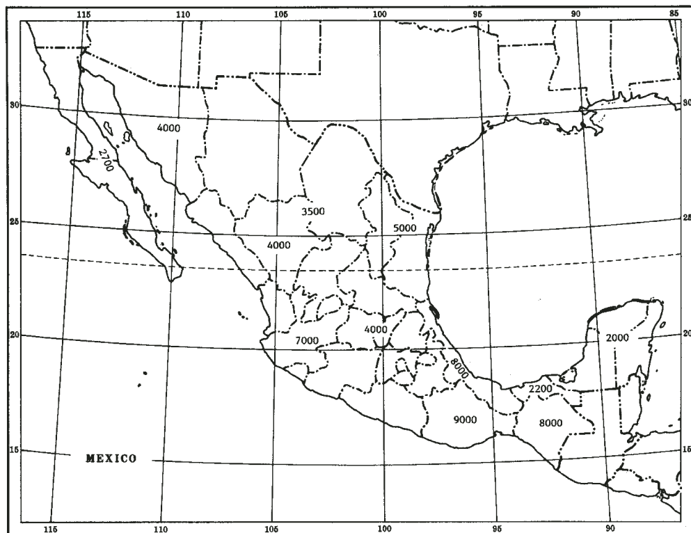
Fig. 1. Riqueza florística actualmente conocida o estimada de algunas regiones de la República Mexicana, expresada en números aproximados de especies de fanerógamas.

pastizales aportan alrededor de 20%. Las "selvas" o bosques tropicales conforman más de un tercio de la flora global, repartido en porciones no completamente equivalentes entre los húmedos por un lado y los semihúmedos y secos por el otro. La participación del bosque mesófilo de montaña es de alrededor de 10%, mientras que cantidades más pequeñas corresponden a la vegetación ruderal y arvense así como a la acuática y subacuática.