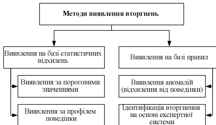
Рис. 1. Класифікація методів виявлення вторгнень

Проведений аналіз та дослідження показали, що в сучасних телекомунікаційних системах та мережах застосовуються наступні методи виявлення та протидії несанкціонованим вторгненням (рис. 1). На сьогоднішній день застосовуються методи виявлення вторгнень із застосуванням математичного апарату математичної статистики, тобто із застосуванням статистичних відхилень, та процедур розробки набору правил поведінки користувачів та аналізу відповідних відхилень їх дії від встановлених правил.