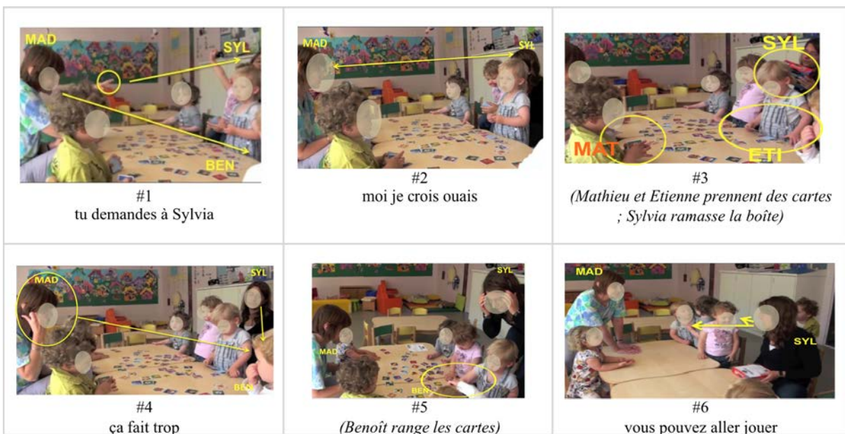
Figure 2 : séquence "les cartes"

Quelques minutes plus tard, Sylvia annonce le lancement de l'activité suivante [#6], ce qui clôt implicitement le rangement. Ainsi Sylvia se trouve positionnée comme animatrice leader à l'issue de la séquence de rangement des cartes, au sein d'un cadre interactif qui s'est transformé à plusieurs reprises. En effet, l'intervention de Benoît a amené Sylvia à mobiliser la relation formative ; puis Madeleine a quitté le statut participatif de témoin - qu'elle occupait en tant que tutrice en observation - pour entrer dans l'activité en produisant une action qui prend la double valeur d'action coopérative et d'étayage tutorial, et a pour effet de maintenir Sylvia dans la position d'animatrice.