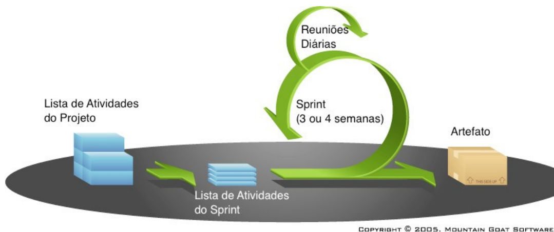
Figura 1 – O ciclo de desenvolvimento eduScrum (adaptado de Mountain Goat Software, 2005)

Cada grupo deve criar o seu quadro de atividades (Kanban). A escolha do formato físico ou virtual depende dos recursos disponibilizados pela instituição de ensino e do nível de proficiência no uso dos recursos de informática.