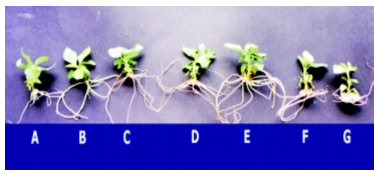
FIGURA 1- Plantas de macieira cultivar M-9 oriundas das diferentes concentrações de AIA - A) 0,5; B) 1,0; C) 5,0; D) 10; E) 20; F) 50; G)100 µM, obtidas durante o enraizamento in vitro no cultivo escuro+auxina.

superiores, ocorreram em função do tipo de raiz e da parte aérea formada, ou seja, ocorreu a formação de raízes mais espessas e formação de calo na base do explante original, como também baixo desenvolvimento da parte aérea. Estas respostas estão de acordo com Mohammed & Vidaver (1990), que relatam que não é somente o tipo de sistema radicular que determina a sobrevivência após a transferência do in vitro para as condições ex vitro , ou seja, o bom desenvolvimento da parte aérea também é fundamental. Altas concentrações de auxinas, além de induzirem maior formação de calo, que pode ser uma barreira para a passagem de nutrientes e água para a parte superior da planta, também ocasiona baixo desenvolvimento da parte aérea em função do excesso de auxina, o qual causa toxidez à planta, levando a uma senescência foliar, comprometendo sua sobrevivência (Grattapaglia & Machado, 1998). O contrário ocorreu com as plantas tratadas nas concentrações de 0,5 e 1,0 µM, as quais apresentaram um bom sistema radicular, bom desenvolvimento da parte aérea e pouco ou sem formação de calo, obtendo, assim, alta porcentagem de sobrevivência. Estas características também foram verificadas nos tratamentos com AIA, porém em uma faixa mais ampla de concentrações, ou seja, de 0,5 a 20 µM, como também das plantas obtidas do tratamento- controle. Isto significa que raízes mais finas, ramificadas e sem a presença de calo determinam melhores condições para uma boa aclimatização.