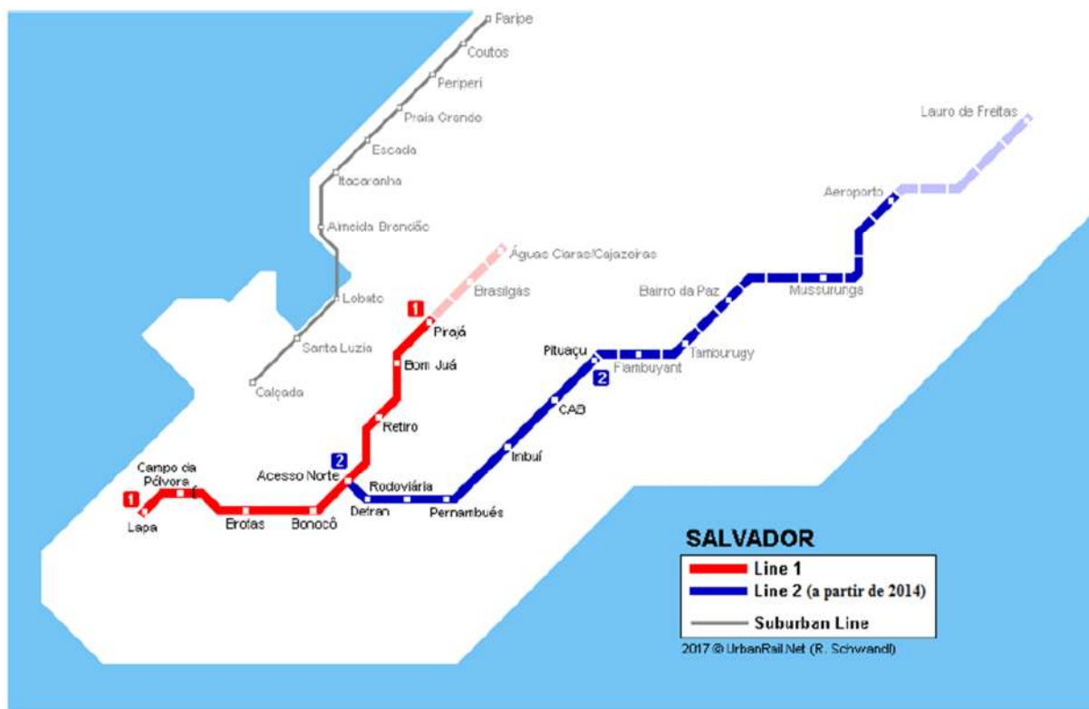
Figura 1 - Linhas 1 e 2 do metrô e a linha de trem do subúrbio

Conforme a Figura 1, o trecho Lapa ↔ Pirajá, da Linha 1, conta com oito estações e uma extensão total de 12,2 quilômetros (SEDUR). Em janeiro de 2020 se encontra em construção o tramo 3 da linha 1 que liga Pirajá com as estações Brasilgás e Águas Claras/Cajazeiras. Em trabalho futuro será adicionado essas estações afim de identificar se ocorreu um aumento de decisões locacionais nessas regiões.