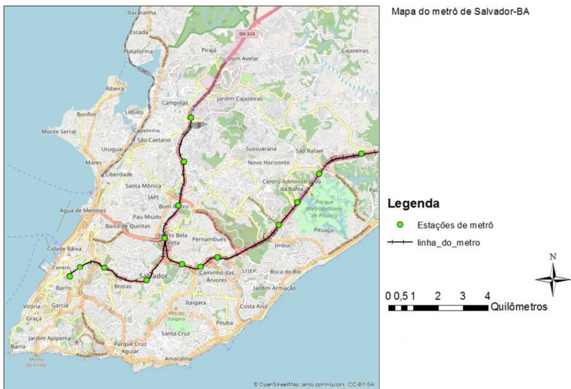
Figura 2 – Trajeto das linhas 1 e 2 do mapa do metrô de Salvador