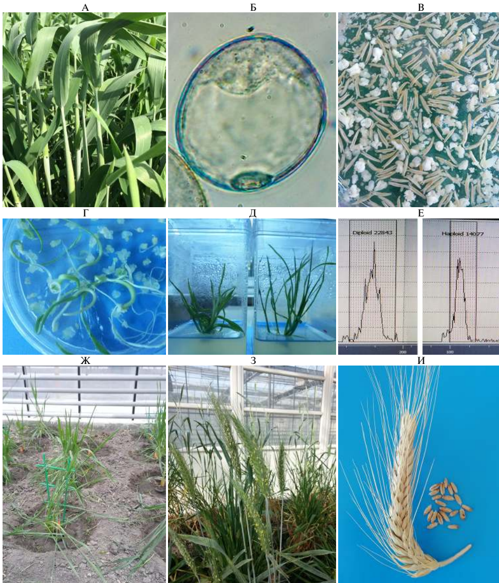
Рис. 2. Основные этапы получения регенерантов в культуре пыльников тритикале ( × Triticosescale Wittmack): А — донорные колосья сорта Зернокормовое 5 в поле; Б — микроспора линии ЯТХ-327-11 на поздней одноядерной стадии (увеличение \times 1000 , микроскоп МТ4000, «Meiji Techno», Япония); В — андрогенные структуры линии Т-968 в среде для индукции эмбриогенеза, II вариант опыта; Г — регенерация растения линии Т-45 из эмбриоидов, III вариант опыта; Д — зеленые растения линии Т-45 на питательной среде для укоренения, II вариант опыта; Е — результаты анализа плоидности на приборе Cy Flow Ploidy Analyser («Sysmex Partek GmbH», Германия); Ж — дигиплоидные растения линии Т-968, II вариант опыта в теплице; З — цветение дигиплоидных растений линии Т-968, III вариант опыта; И — колосья с семенами фертильных дигиплоидных растений линии Т-968, II вариант опыта. Описание вариантов опыта см. в разделе «Методика».

симальную частоту регенерации зеленых растений зафиксировали у генотипа Зернокормовое 5 (8,6 шт/100 пыльников) (см. табл. 1). Результаты наших исследований сопоставимы с данными, полученными в исследованиях F. Eudes с соавт. (30) и S. Tuveesson с соавт. (31) (6 и более зеленых растений на 100 пыльников). Большие значения (10,8-16,8 зеленых растений на 100 пыльников) получены венгерскими учеными (4, 13).