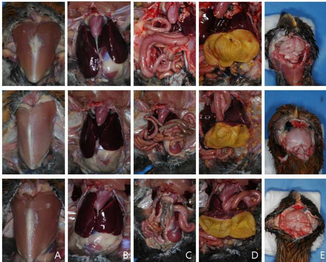
Fig. 1. Necropsy findings of chickens fed CS61 culture-containing diet for 28 days (A, muscles; B, heart and liver; C, intestine; D, gizzard; and E, brain). Upper panel, control group; middle panel, CS61 culture 0.1% group; and lower panel, CS61 culture 1% group.