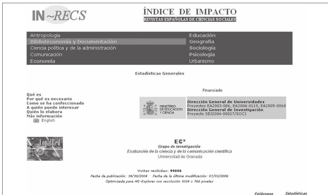
Figura 4. Home page de In-Recs (Índice de impacto de las revistas españolas de ciencias sociales) http://ec3.ugr.es/in-recs/