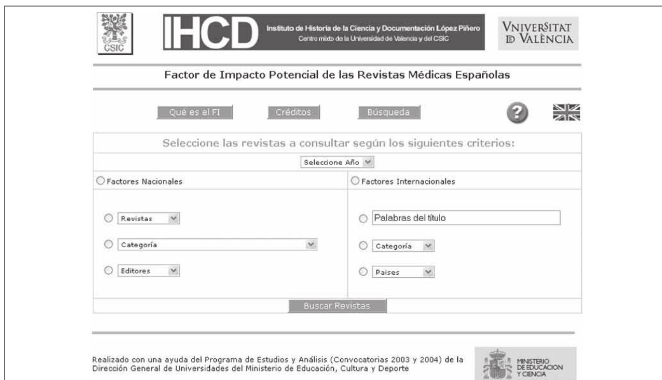
Figura 2. Home page del Factor de impacto potencial de las revistas médicas españolas http://ime.uv.es/imecitas/impacto_ime.asp