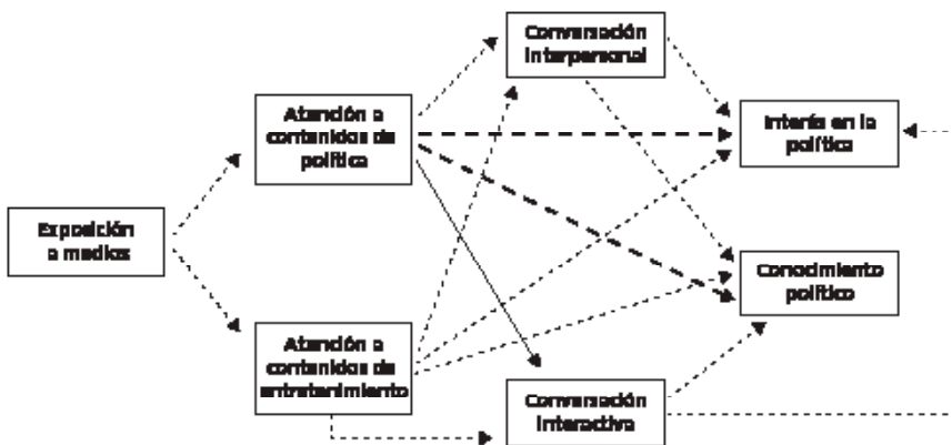
Figura 2. Especificación de modelo de entrada (Modelo teórico 1).

En el modelo teórico diseñado, se muestra el conjunto sistemático de relaciones entre variables que aportan una explicación del fenómeno que se pretende estudiar. Se procedió a realizar la estimación del modelo. Para ello, se requería cumplir ciertos supuestos. Primero se realizó el análisis de validez convergente, con el que se determina el grado en que los ítems de la escala