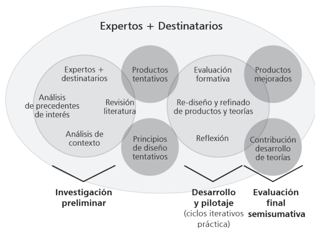
Figura 1. Modelo genérico de investigación basada en el diseño.

La metodología de investigación escogida se basa en una secuenciación o fases que nos ayudan a estructurar todo el proceso (Plomp, 2013): investigación preliminar, desarrollo y pilotaje y evaluación final (Figura 1). En la primera fase, de investigación preliminar, se realiza un análisis de las necesidades, descripción del problema y revisión de la literatura especializada. De esta fase destaca la colaboración de expertos y destinatarios en el análisis de necesidades, estudio y definición del problema. La fase de desarrollo y pilotaje se estructura en diferentes ciclos interactivos de aplicación y evaluación buscando la mejora progresiva del producto. Es cuando se producen estos nuevos productos mejorados cuando se contribuye a la creación de principios de diseño y a la fundamentación de teorías. Finalmente, en la última etapa, se valora hasta qué punto los productos finales cumplen la finalidad de la investigación.