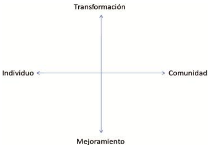
Figura 1. Plano de la intersección de los ejes Individuo/Comunidad y Transformación/Mejoramiento

Por tanto, este eje Mejoramiento/Transformación registra la dimensión política del uso de las acciones, y vendrá a ser el que da cuenta de las tensiones específicas del campo que, en contextos sociales e históricos concretos, inducen a formaciones objetivas distintas. En consecuencia, caracterizaremos este segundo eje vertical, como el eje del sentido, de la fuerza. En el extremo de la transformación situaremos su forma ideal, siempre inacabada en su logro último; en el polo del mejoramiento vendremos a situar, en cambio, las definiciones más concretas de las acciones paliativas. El cruce de ambos ejes se esquematiza en la Figura 1: