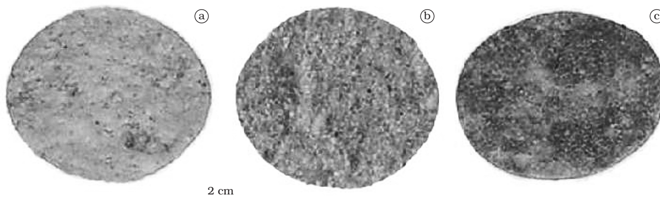
Figura 2. Biscoitos, tipo salgado, elaborados com farinhas mistas de trigo e berinjela em diferentes concentrações: a) Biscoito I (90% de farinha de trigo – FT:10% de farinha de berinjela - FB); b) Biscoito II (85FT:15FB); e c) Biscoito III (80FT:20FB).

A expansão dos biscoitos diminuiu com o aumento da concentração de farinha de berinjela enquanto o volume específico teve um ligeiro aumento e a coloração do se tornou mais escura.