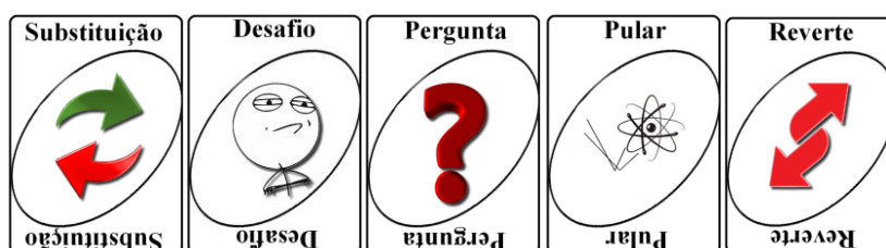
Figura 2: Cartas especiais

No jogo haviam outros tipos de cartas especiais, o que o tornava mais próximo do jogo padrão. Um exemplo é a carta de “substituição” que servia para substituir/alternar o jogador atual por outro membro da equipe. Se a carta fosse uma do tipo “desafio”, a equipe deveria cumprir com uma tarefa proposta. Caso o desafio não fosse cumprido o jogo do representante era completamente substituído, dando-lhe 9 novas cartas do monte. A carta chamada “pular” fazia com que o jogador seguinte perdesse a vez de jogar por uma rodada. A carta “reverte” deslocava o jogo no sentido contrário ao que já estivesse como pode-se ver os exemplos das cartas na Figura 2 abaixo.