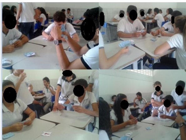
Figura 3: Fotografia dos discentes durante aplicação do jogo Elementum

Os alunos demonstraram-se muito interessados pela atividade desenvolvida, de modo que houve grande participação de todos em diferentes grupos. Alguns momentos da aplicação do jogo podem ser verificados a partir dos registros apresentados na Figura 3, a seguir.