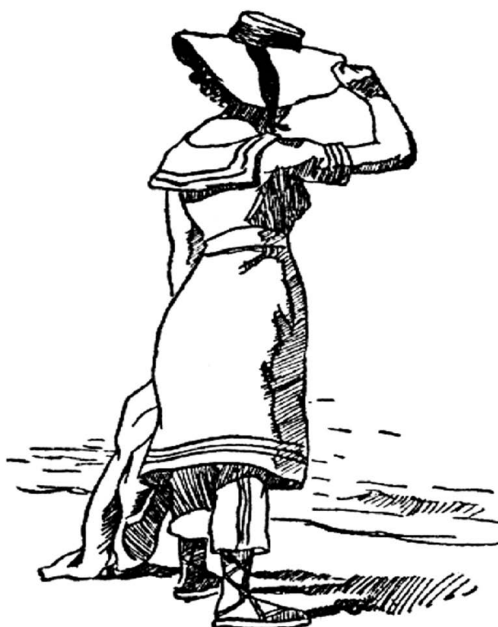
Roupa feminina para banhos de mar 62

calças muito largas de baeta tão áspera que mesmo molhada não lhe pode cingir o corpo. Do mesmo tecido, um blusão com gola larguíssima, à marinheira, obrigada a laço, um laço amplo que serve de enfeite e, ao mesmo tempo, de tapume a uma possível manifestação de qualquer linha capaz de sugerir o feitiço vago de um seio. As calças vão até tocar o tornozelo quando não caem num babado largo, cobrindo o peito do pé. Toda a roupa é sempre azul-marinho e encadardada de branco. Sapatos de lona e corda, amarrados no pé e na perna, à romana. Na cabeça, vastas toucas de oleado, com franzido à Maria Antonieta, ou exagerados chapelões de aba larga, tornando disformes as cabeças, por uma época em que os cabelos são uma longa, escura e pesada massa. 61