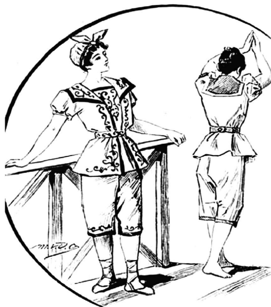
Roupas femininas de natação 72