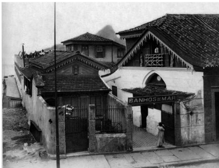
Casa de Banho na rua Santa Luzia. Na parte de trás, se encontra o mar (pode-se ver na imagem a ponta do Pão de Açúcar). Década de 1910.

Em função dessas preocupações, foi de grande importância a instalação de casas de banhos no litoral. Funcionavam como vestiários que permitiam a troca e a guarda das roupas, eximindo os banhistas e nadadores de andarem pelas ruas com os “escandalosos” trajes apropriados para o mar. Além disso, era também oferecida alguma estrutura de segurança para os frequentadores.