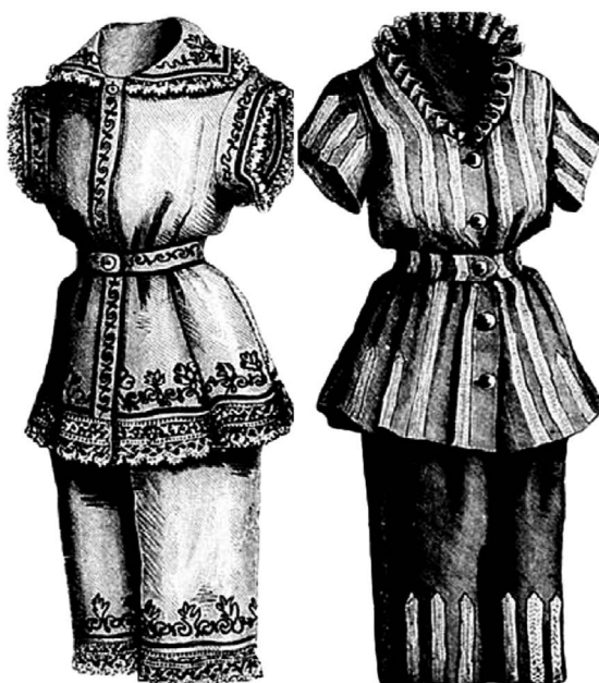
Roupas femininas de banhos de mar 66

Pelos números de A Estação , periódico que tinha a moda como assunto principal, 64 podemos acompanhar as sugestões de vestimentas para as mulheres que procuravam os banhos de mar e a natação. Em 1879, apresentou-se o seguinte modelo: “A blusa e a calça são abotoadas, uma à outra, no cinto sofrivelmente largo, pregado de modo a correr com facilidade. Este modelo, de baetilha branca, é apertado por uma faixa, e enfeitado de bordado a ponto de marca”. 65