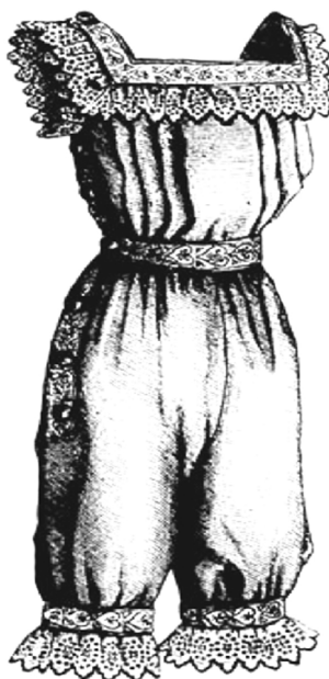
Roupa feminina de banhos de mar 69

A longa matéria descreve todos os detalhes da vestimenta, ainda bastante rigorosa se compararmos aos parâmetros atuais. Todavia, há que se destacar que a abordagem enfatiza mais a elegância e o conforto do que o pudor, embora essa seja uma dimensão que não deve ser negligenciada. Essa mudança pode ser sutilmente observada na “maior ousadia” de um modelo publicado no periódico numa edição de 1881: 68