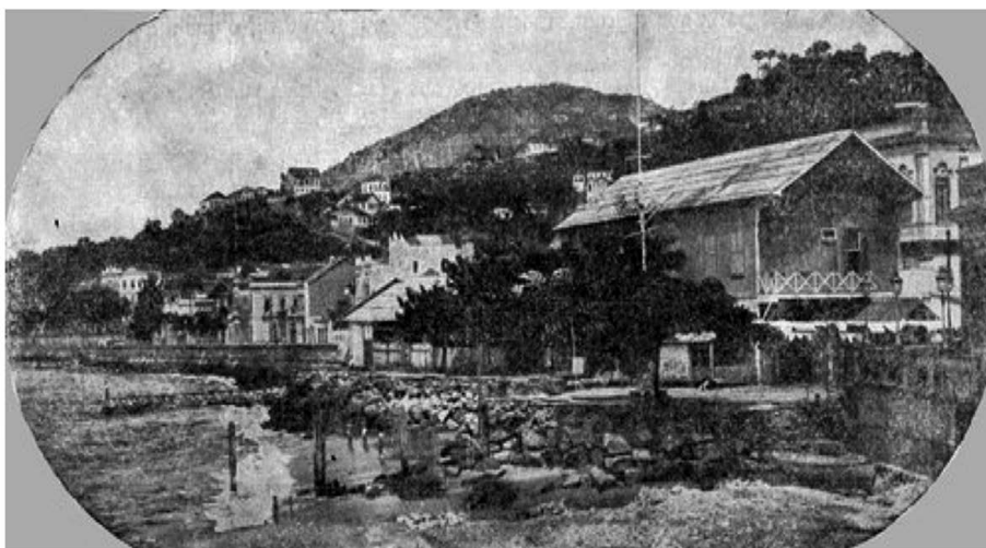
Sede do Clube de Natação

uma ideia, o prédio branco que se situa atrás da sede é do Silogeu Brasileiro, onde hoje está o prédio do Instituto Histórico e Geográfico Brasileiro.