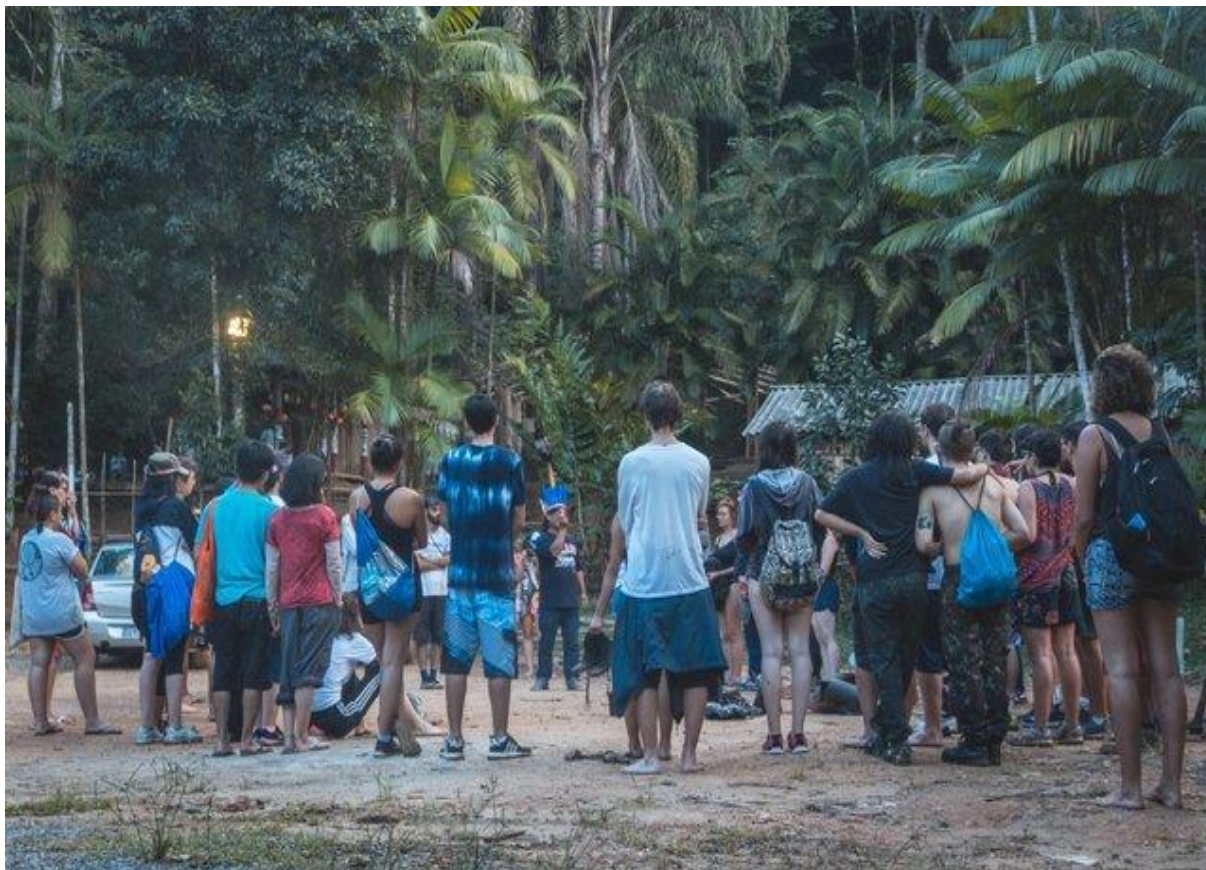
Figura 4 - Roda de conversa entre os alunos e o Cacique durante a vivência indígena. Território Indígena do Rio Silveira, Bertioga, São Paulo/BR. 2019.

estruturais nas epistemologias, na relação com o meio ambiente e nas dinâmicas econômicas que permeiam as relações sociais e a cultura (Machado, 2016; Mello-Théry, 2011), olhando para o modo de vida Guarani como modelo quando se fala de bem estar coletivo e de integração com a natureza.