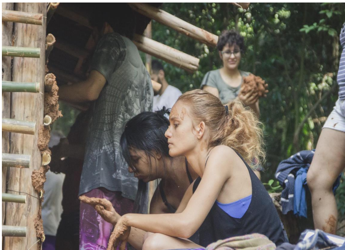
Figura 8 - Construção e barreamento de uma casa tradicional indígena. Território Indígena do Jaraguá, São Paulo/SP/BR. 2019.