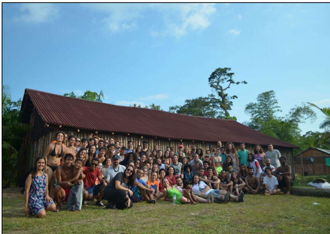
Figura 9 - “Opy” (Casa de Reza) construída pela parceria do Projeto de Extensão “Aliança USP-Guaranis” e o Território Indígena do Rio Silveira, Bertioga, São Paulo/BR (abril de 2018).

No Território indígena do Rio Silveiras, a rede de contatos dos alunos conseguiu levar expedições de dentistas e médicos, oferecendo atendimentos e tratamentos de baixa e média complexidade para todos os integrantes do território; e inclusive construir aquela que é um das maiores Opy (casa de Reza) Guarani no Brasil, com capacidade para cerca de 250 pessoas.