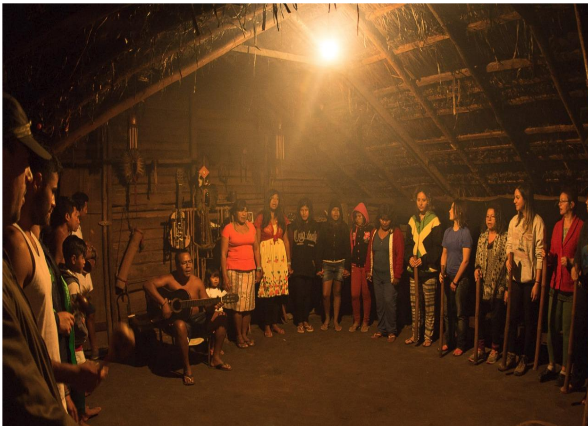
Figura 5. Reza Guarani dentro da Opy (casa de reza). Território Indígena do Rio Silveira, Bertioga, São Paulo/BR. 2018.

A proposta pedagógica rompe com a dicotomia clássica entre a razão e a emoção, fazendo de ambas as partes uma unidade. Através da emoção sentimos o ecoar dos ancestrais no canto dos indígenas, os encantamentos da natureza através das suas geometrias, sons e aromas, pelo sentir rompem-se as barreiras do tempo-espaço e da própria racionalidade eurocêntrica 4 . Através daquilo que a emoção nos permite acessar, qualificamos a razão e nos sentimos mais esclarecidos com relação aos nossos propósitos, as situações de vida e dos aprendizados que se apresentam. O ritual do pajé na Opy ocorre todas as noites, sendo o ponto alto do dia. É onde colocamos em cheque nossa racionalidade e os nossos valores. O transe do pajé, o canto simétrico das indígenas, a fumaça dos cachimbos, o som das maracás, pés descalços, mãos dadas, todos como filhos da terra. Sem entender uma palavra, sem poder racionalizar, estudantes se emocionam, choram, como se lembrassem de algo importante. Aquele ambiente simples da aldeia, com gente descalça - para muitos apenas “pobres” -, se transforma num espaço de nobreza, de pureza. O pajé defuma os alunos e alunas, cospe, chega a vomitar. A