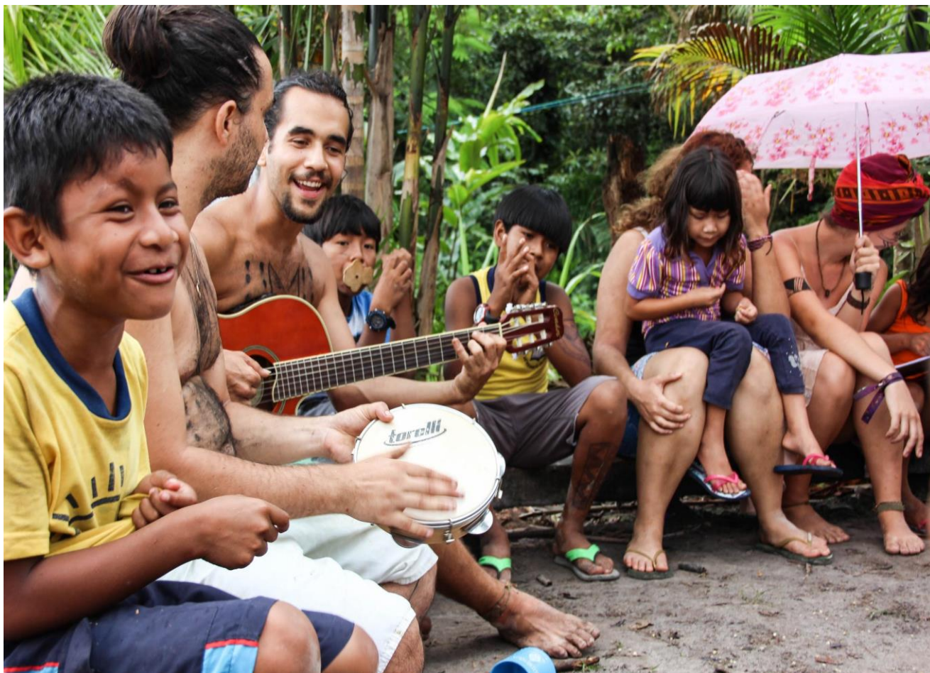
Figura 6. Roda de música e de contação de história entre alunos e indígenas. Território Indígena do Rio Silveira, Bertioga, São Paulo/BR. 2015.

Essa foi tanta uma pergunta como uma afirmação repetida várias vezes por alunos. “Não, não é socialismo e aqui sequer existe Estado”. Como qualificar dentro das narrativas colonizadoras eurocêntricas (Machado & Nascimento, 2018), o modo de vida indígena? Nhanderekó e o teko porã (guarani), sumak kawsay (quechua), Suma Qamaña (aymara) são alguns nomes de diferentes tradições para um modo de vida em harmonia e integração com a natureza e a comunidade. Simplesmente não cabe em nossa régua.