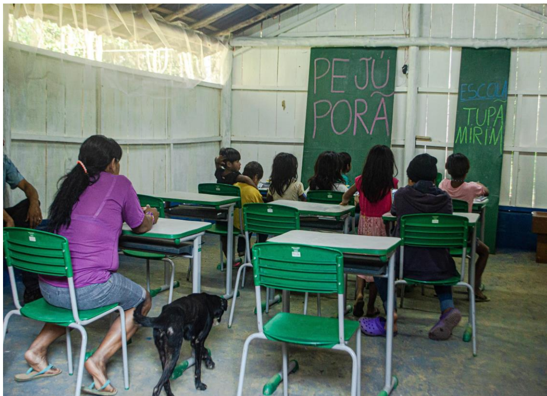
Figura 7 - Momento da entrega da sala de aula concluída para a aldeia. Território Indígena Brilho do Sol, São Bernardo do Campo/SP/BR. 2020.