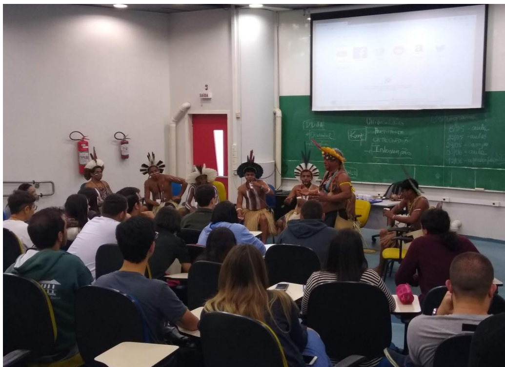
Figura 1 - Roda de conversa entre os alunos e as etnias Kariri-Xocó e os Fulni-ôs. Escola de Artes, Ciências e Humanidades da Universidade de São Paulo (EACH/USP). São Paulo/BR. 2019.