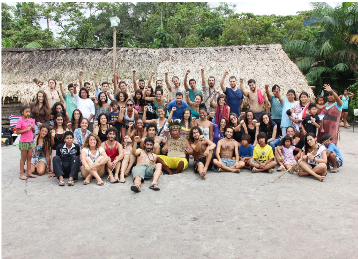
Figura 2 - Primeira turma a fazer vivência indígena. Território Indígena do Rio Silveira, Bertioga, São Paulo/BR. 2015.

Cada ano há um tema-mestre que vai guiar as atividades na aldeia. Em 2019, a organização da disciplina fez uma abordagem interdisciplinar da segurança alimentar indígena, promovendo o debate acerca dos hábitos alimentares ocidentais (Mello-Théry, 2018) contemporâneos e seus impactos sobre a alimentação tradicional e na saúde indígena. Cabe dizer que cerca de metade do tempo são oferecidas atividades na aldeia, a outra metade consiste na participação de atividades, eventos e rezas da comunidade indígena.