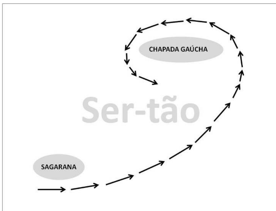
Figura 3 – Caminho do Sertão como representação de “ser-tão”.