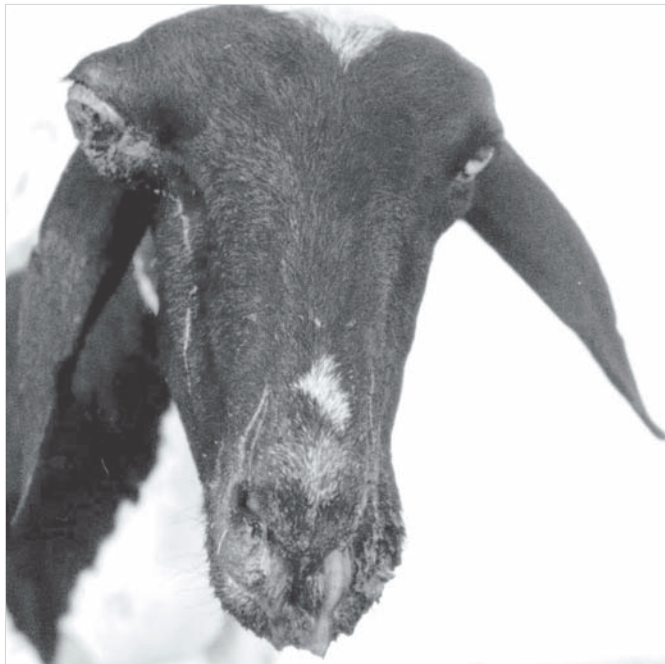
Fig.3. Assimetria do crânio com exoftalmia, aumento de volume do globo ocular, ulceração da córnea e corrimento ocular, na conidiobolomicose de ovino.

onde se observou que houve associação entre semestre e a incidência da doença ( \chi^2 ; P < 0,05 ), sendo mais elevada no primeiro semestre (2,10%) do que no segundo (0,69%). A Figura 2 mostra a distribuição da precipitação pluviométrica dos anos de 2002-2004 em municípios de ocorrência da doença, onde as chuvas são concentradas principalmente no primeiro semestre. Nesta região a temperatura varia de 19-36°C e a umidade relativa do ar de 40-80%.