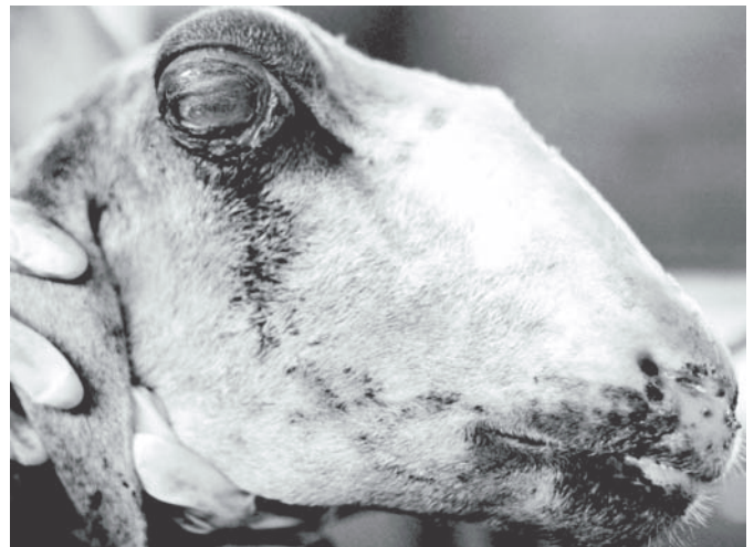
Fig.4. Exoftalmia, aumento de volume do globo ocular, inflamação e ulceração da córnea e esclerótica, na conidiobolomicose de ovino.

Os animais submetidos aos exames clínico e anatomo-patológico ( n = 60 ) eram principalmente fêmeas (63,3%) e com idade variável, sendo que 65% tinham 1-5 anos. Os principais sinais clínicos caracterizaram-se por anorexia, apatia, febre,