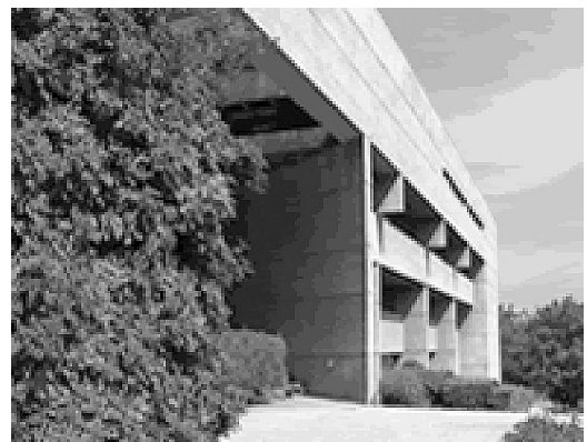
巨大な要塞を思わせるコレヒオの建物

コレヒオを代表し, 研究教育事業の実施の責任を負うのが学長 (presidente) である。2005