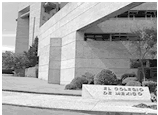
エル・コレヒオ・デ・メヒコの正面入口

コレヒオは7つの研究センターと図書館、出版、コンピューター・システム管理などの支援部門から構成されている。7つの研究センターとは、上述の歴史学研究センターに加えて、言語学・文学研究センター (Centro de Estudios Lingüísticos y Literario: CELL)、国際問題研究センター (Centro de Estudios Internacionales: CEI)、アジア・アフリカ研究センター (Centro de Estudios de Asia y Africa: CEAA)、経済研究センター (Centro de Estudios Económicos: CEE)、人口・都市・環境問題研究センター (Centro de Estudios Demográficos, Urbanos y Ambientales: