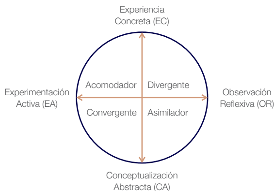
Figura 2. Estilos de aprendizaje; Disponible en: www.jlgcue.es

A partir del modelo experiencial de aprendizaje, David Kolb y su colega Roger Fry crearon en 1995 los ESTILOS DE APRENDIZAJE, bajo la concepción de que, según las características de cada estudiante, alguna de las combinaciones de las etapas del ciclo favorece más su aprendizaje que las otras.