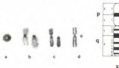
Figura No. 2. a. Cromosoma X en anillo, r(X), bandas C. b. A la izquierda cromosoma X normal, bandas C, a la derecha cromosoma X con delección total de brazos cortos y centrómero en telómero, 46,X,tel(Xq). c. Igual que b, bandas R. d. A la izquierda cromosoma X normal; a la derecha fragmento de X, 46,X,f(X), coloración de Giemsa. A la derecha diagrama del cromosoma X con bandas G.

Una de las pacientes con anillo presentó un 21% de células con un diminuto fragmento en el que no se observaban brazos y correspondió a un fragmento céntrico.