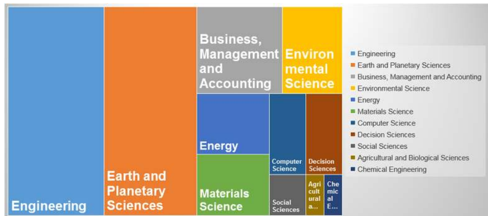
Figura 2 Ramas, según la clasificación de Scopus (en inglés), que han publicado trabajos sobre lean management en industrias mineras.

Finalmente, por medio de un análisis de coocurrencias con VOSviewer, podemos localizar las principales palabras clave que definen este campo de estudio (Figura 3). Podemos observar que destaca la minería del carbón, y ciertamente las explotaciones carboníferas predominan en los trabajos revisados, aunque como veremos en la próxima sección hay evidencias de la aplicación de LM en los procesos de obtención de múltiples tipos de recursos. Por un lado, se