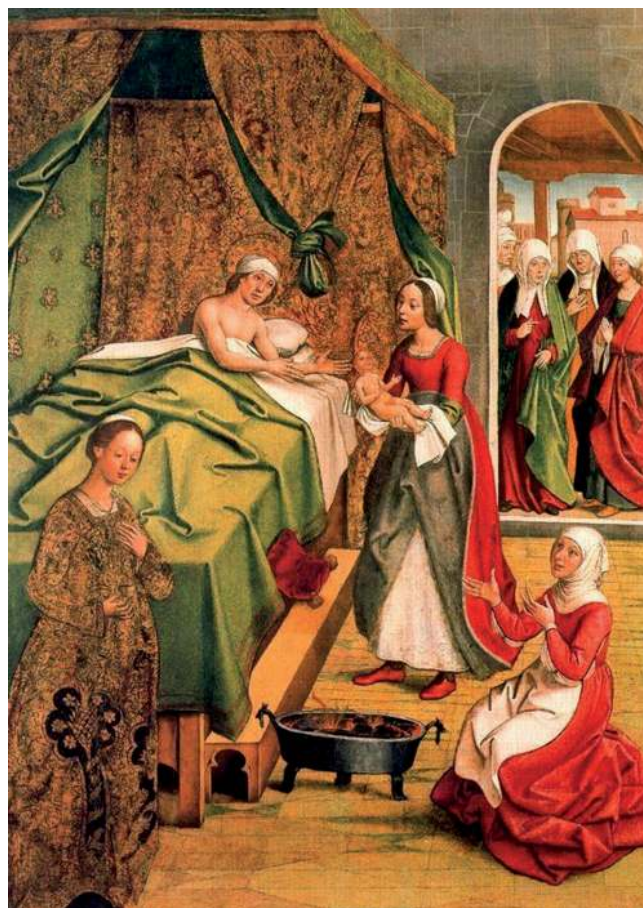
Figura 7.- Nacimiento de la Virgen (c. 1485-1490). Pedro Berruguete. Ejemplo de cama rica con paramento verde y leonado.