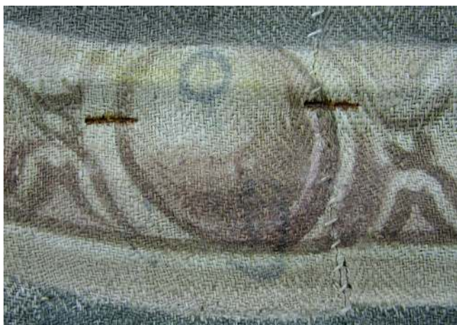
Figura 3.- Temple del ciclo de la vida de San Pedro Regalado, realizado por Diego de Frutos y que lleva por título Reparte objetos religiosos a niños y madre en pie, reverentes y bien trajeados . Iglesia del Convento de la Aguilera, Aranda de Duero (Burgos). 2,50 m X 3,20 m aprox. Ligamento de espiguilla apreciable en el anverso.

Además, continuando con el estudio del significado de las palabras que aparecen en las ordenanzas de Córdoba de 1493, “pyntura e obra de las sargas sobre lienzos”, puede definirse el concepto de “lienzo”, de manera precisa, de acuerdo a la versión que aportan diversos diccionarios. Básicamente éstos definen el término como una tela de lino, utilizada en algunos casos para pintar. No se menciona el tipo de ligamento empleado. El Tesoro de la Lengva (1611) de Covarrubias define este vocablo como “tela hecha y texida de lino. Lat. Lintheum a lino. [...] Lienços sinifican muchas veces los quadros pintados en lienço” (Covarrubias 1611).