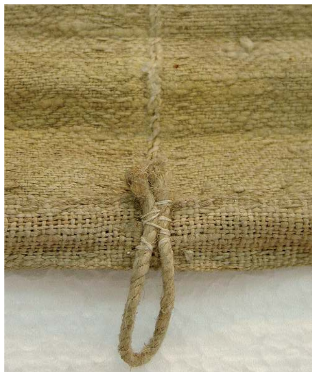
Figura 2.- Detalle del reverso de uno de los templos del ciclo de San Pedro Regalado donde se aprecia el ligamento de espiguilla.

Existen, no obstante, algunos ejemplos, escasos, del empleo de esa espiguilla en España. Puede hacerse referencia a las pinturas al temple sobre tejido de lino con este ligamento en el ciclo de la Vida de San Pedro Regalado, del Santuario de la Aguilera de Aranda de Duero (Burgos), aunque esta obra es de la primera mitad del siglo XVIII. Este ligamento de espiguilla presenta base sarga de 5, 4:1 [figuras 2 y 3].