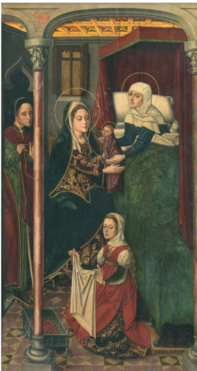
Figura 6.- Nacimiento de san Juan Bautista (1490-1500). Maestro de Miraflores. Museo Nacional del Prado, Madrid. Pintura al óleo sobre tabla donde se aprecia un dosel de cama de color rojo.