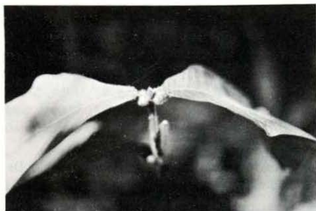
Fig. 1 — Aspecto dos mirmecodomáceos de Duroia saccifera Hook

Houve uma diversidade de espécies de formigas nos mirmecodomáceos, assim como uma considerável variação na quantidade destas. Nota-se também a ocorrência de uma mesma espécie de formiga associada com diferentes espécies de vegetais, crescendo em habitat diversos, como o caso de Solenopsis sp. com Duroia saccifera Hook. (Fig. 1) e Hirtella duckei Hub. (Fig. 2); Azteca sp. (I) com Tococa coronata Benth. e Cordia nodosa Lam. Ainda nesta espécie encontramos a rainha Pseudomyrmex sp.