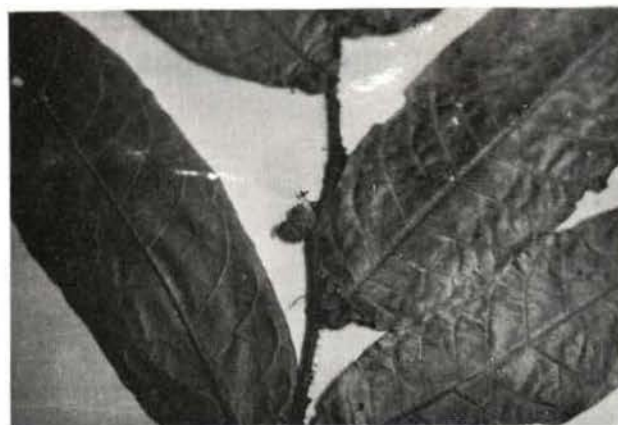
Fig. 2 — Mirmecodomáceos de Hirtella duckei Hub.

Tococa coronata Benth. (Fig. 3), na época chuvosa, tem o habitat dentro do igarapé e apresenta associação com formigas de outra espécie de Azteca (sp. II); Maieta guianensis Aublet (Fig. 4), por sua vez, apresenta associação com Allomerus sp.