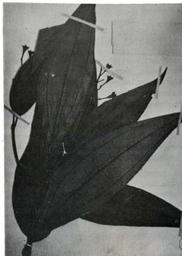
Fig. 3 — Mirmecodomáceos de Tococa coronata Benth.

Tococa coronata Benth. (Fig. 3), na época chuvosa, tem o habitat dentro do igarapé e apresenta associação com formigas de outra espécie de Azteca (sp. II); Maieta guianensis Aublet (Fig. 4), por sua vez, apresenta associação com Allomerus sp.