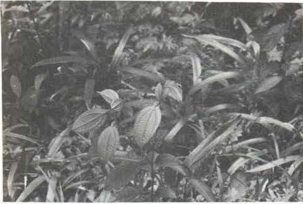
Fig. 4 — Aspecto dos mirmecodomáceos de Maieta guianensis Aublet

Observamos ainda que o número de formigas não está relacionado com o tamanho e posição dos mirmecodomáceos, nem com a temperatura, visto que tanto os mirmecodomáceos grandes como os pequenos apresentaram variação na quantidade de formigas.